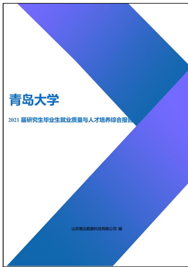
图 6-1 青岛大学 2021 届研究生毕业生就业质量与人才培养综合报告

山东智远数据科技有限公司作为第三方就业质量评价公司，发布了《青岛大学 2021 届研究生毕业生就业质量与人才培养综合报告》（如图 6-1 所示），对青岛大学的研究生毕业生就业质量和人才培养情况进行了分析：青岛大学 2021 届研究生毕业生在毕业去向落实率、薪酬、工作满意度、工作稳定性、母校满意度和母校推荐度等评价指标中均取得卓越的成绩，人才培养质量在全国名列前茅。其中，毕业生税前薪酬为 8281.51 元/月，其工作满意度为 96.32%，专业相关度为 83.78%，职业期待吻合度为 92.66%，工作稳定性为 91.02%。77.89% 的研究生毕业生选择在省内就业，服务本地经济发展，就业单位以“世界及中国 500 强”为主（如图 6-2 所示）。