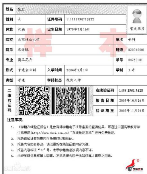
教育部学籍在线验证报告

四、高校驻地在青岛市的应届本科毕业生（含全日制成人大高校应届本科毕业生）：须上传“中国高等教育学生信息网”的《教育部学籍在线验证报告》。